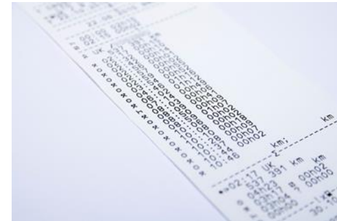
Krav til effektivisering