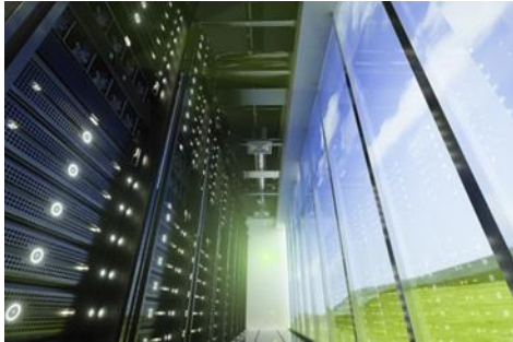
Eksplisiv økning i informasjonsmengden